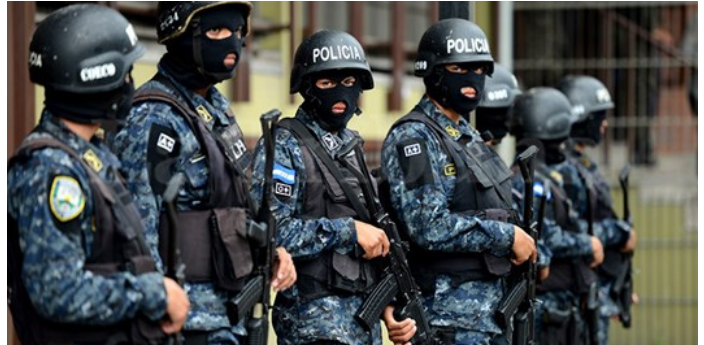
Militaires TIGRES attachés la police hondurienne

Au total, il existe 19 unités policières et militaires différentes au Honduras, dont les responsabilités peu-