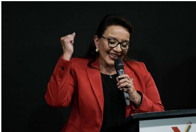
La future présidente Xiomara Castro

Le dimanche 26 novembre dernier, au soir même des élections présidentielles, la candidate de gauche Xiomara Castro a revendiqué dimanche soir la victoire pour la présidence du Honduras face au dauphin du président de droite sortant, dans un pays en proie à la violence des trafiquants de drogue, qui ont étendu leur corruption jusqu'au plus haut niveau de l'État. Deux jours plus tard, son principal rival reconnaîtra sa défaite. L'article qui suit a été publié dans le journal La Libre Belgique du mardi 28 novembre 2021.